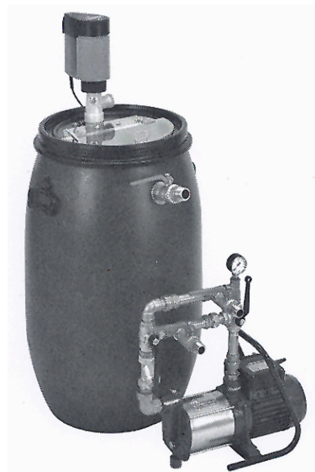
Entkalkungsgerät für Boiler und kleine Systeme wahlweise mit Tauch- oder Profipumpe